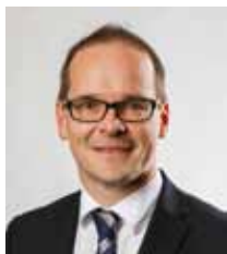
Грант Хендрік Тонне Міністр культури Нижньої Саксонії

На цій основі Ви зможете прийняти обґрунтоване рішення щодо подальшого освітнього шляху Вашої дитини. Спільною метою має бути щаслива дитина, яка мотивована відповідати вимогам обраного типу школи.